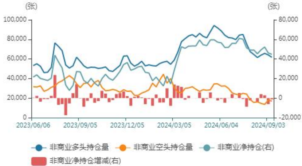
非商业持仓走势图