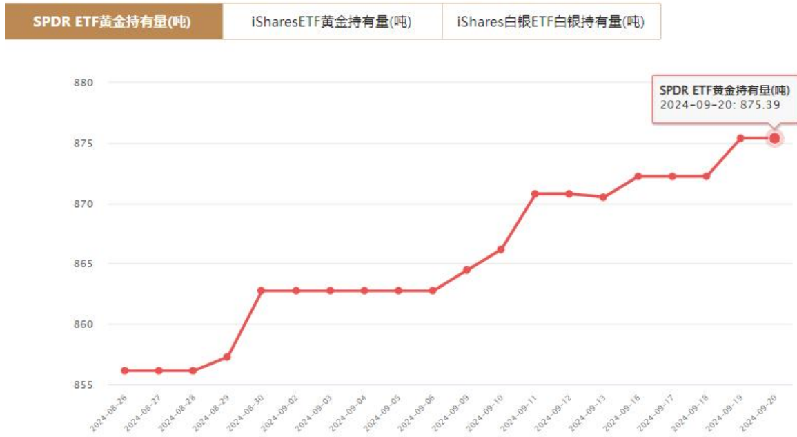
SPDR 黄金 ETF 黄金持有量(吨)

美国商品期货交易委员会（CFTC）：9月17日当周，投机者持有的白银非商业净多仓为58,298张合约，较1周前的44,742张增加了13556张。白银的非商业净多头头寸明显增加。